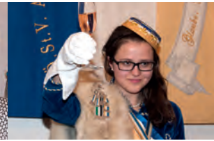
Hoch die Tassen – Familia, Tango, FM Panik am Präsid – fiducit!