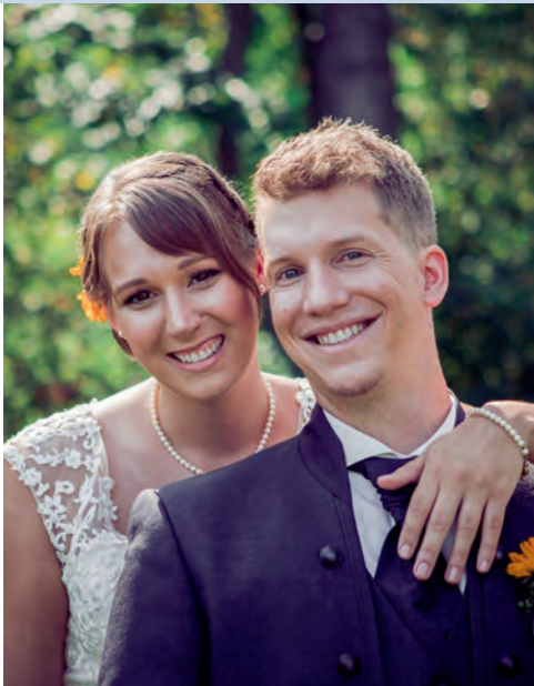
Am 9.9.2017 heirateten Nike, AcG und Batman, Wi – wir gratulieren!

Nur die Liebe zählt ~ zweimal Hochzeitstag!