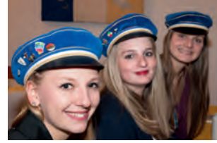
Ballerina, Arnetmetia, Amneris

Volle Bude, tolle Stimmung – und mehr muß man gar nicht dazu sagen!