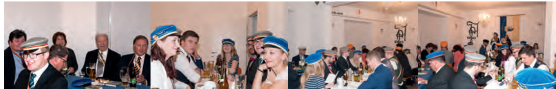
Seniora Tigris schlägt die Kneipe mit Begeisterung