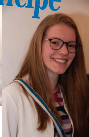
FM Arnetmetia nimmt Neofux Rubin in die Academia auf..