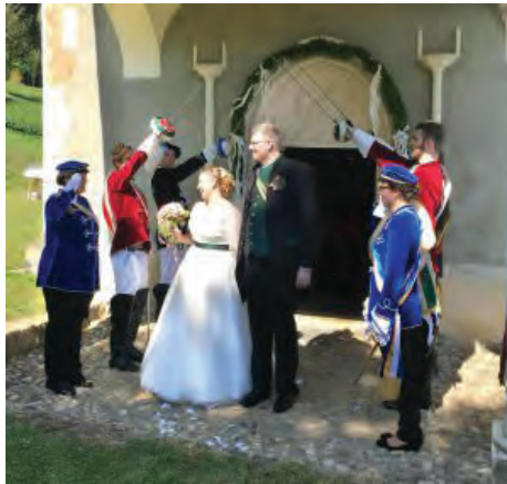
...Bundesschwester Nala und Cbr. Nagelprobe, Alb zur Vermählung