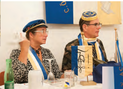
Bewährtes Team auch im Inofficium: Merlot, AcG & Raschl, Trn haben sichtlich Freude an ihrer Aufgabe im Präsidium