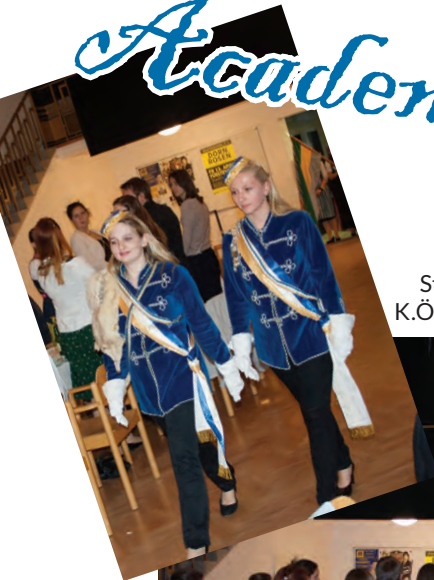
Stiftungsfest K.Ö.St.V. Vulkania