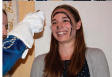
rechts: Szenen einer Branderung: FM Arnetmetia, Neo-Brandfux Smaragd, Merlot