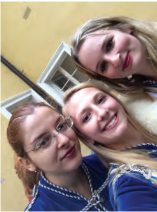
Chargierte beim Abschlussgottesdienst des akademischen Jahres: Thalia, Ballerina, Arnetmetia