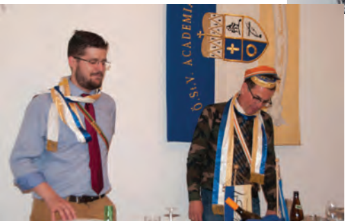
Im 2. Teil übernimmt Sicha Net, Alb für Merlot das Inoffiz-Conpräsid