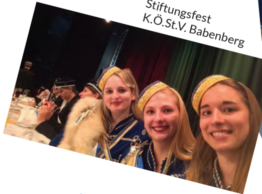
Stiftungsfest K.Ö.St.V. Babenberg