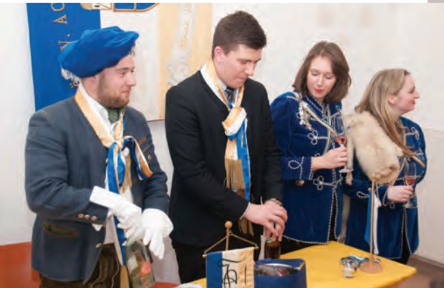
Inofficium: Oktan, Wi und Gönneral, BbG übernehmen die Kneipgewalt und verabschieden das Präsidium