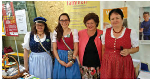
Ennia & Mexalen vertraten die Academia anlässlich 800 Jahre Diözese Graz-Seckau in der Herrengasse, ebenso vertreten: Familia, AcG (Familienverband) und Ks. Baltsa, HEG