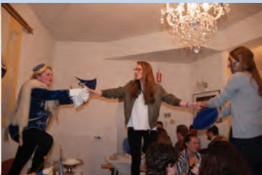
FM Arnetmetia, Rubin, Neobrandfux Smaragd mit vollem Einsatz bei der Fuxenstrophe