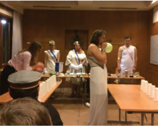
Olympisch ging es bei der Fuxenkneipe der Academia mit der Babenberg zu: Phil-x Medici und x Nike messen sich im Luftballon-Becherpusten