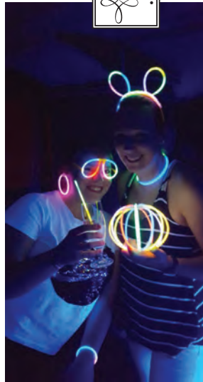
Bunt ging es bei der Schwarzlichtparty auf der Bude zu... Gibson und Nike in Feierlaune