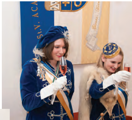
Das Präsidium verabschiedet sich mit seinem Ehrenrest: x Nike, FM Arnetmetia